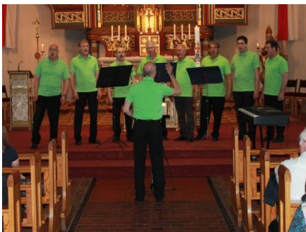
Six for one

So unterschiedlich die teilnehmenden Vereine sind, so unterschiedlich waren auch die musikalischen Beiträge, hier ein reiner Männerchor, da ein Frauenchor und viele gemischte Chöre von klassischem Liedgut bis hin zu reiner Gospelmusik, oder kleine und feine Ensembles.