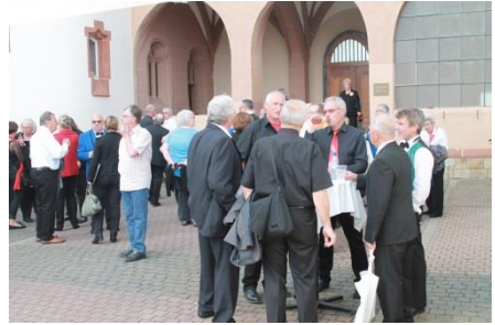
Treffpunkt Pfarrhof: Vor, während und nach dem Konzert gab es viele Chorübergreifende Gespräche bei Getränken und Snacks

Klassische Chorliteratur, unter anderem dem „Warum bist du gekommen, Wenn du schon wieder gehst (Bajazzo)“, kam vom Gemischten Chor des Sängerbunds Heppenheim.